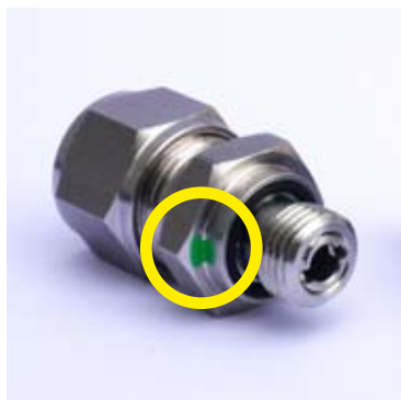
Verschraubung mit Filter (mit zwei grünen Punkten gekennzeichnet)