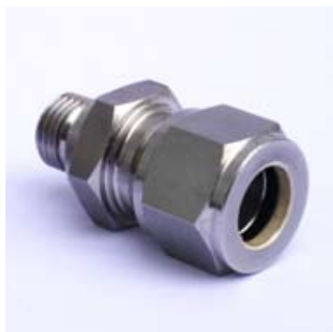
Verschraubung ohne Filter

Die Verschraubungen werden paarweise geliefert: Diese sind mit Filter am Eingang und ohne Filter am Ausgang zu montieren.